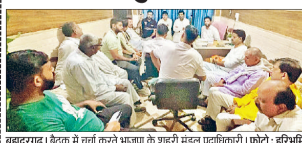
बहादुरगढ़। बैठक में चर्चा करते भाजपा के शहरी मंडल पदाधिकारी।