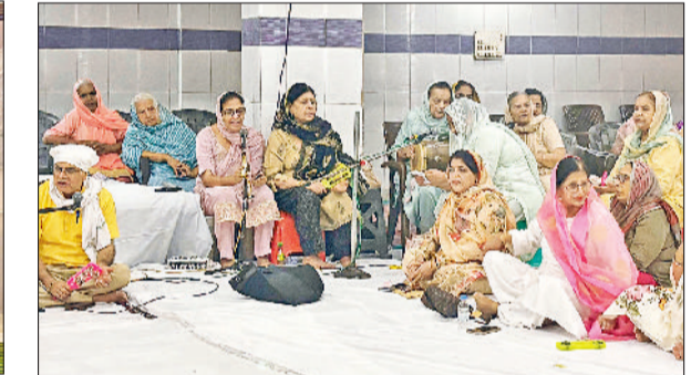
बहादुरगढ़। समागम के दौरान कीर्तन करती स्त्री सत्संग सभा की सदस्य।