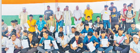
झज्जर। आयोजकों के साथ मंच पर उपस्थित प्रतियोगिता के विजेता खिलाड़ी।