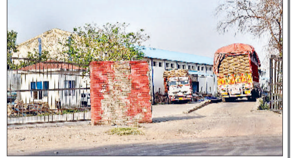
झज्जर। वेयरहाउस गोदाम के अंदर खड़े ट्रक।

1 लाख 64 हजार 821 मीट्रिक टन गेहूं की हुई खरीद