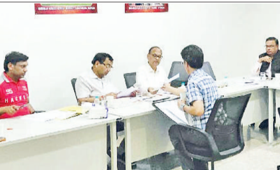
बहादुरगढ़। अभ्यर्थी का इंटरव्यू लेते अस्पताल ट्रस्ट के पदाधिकारी।