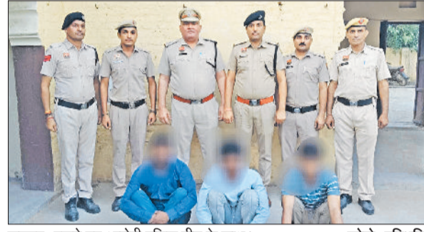
झज्जर। पकड़े गए आरोपी पुलिस टीम के साथ।