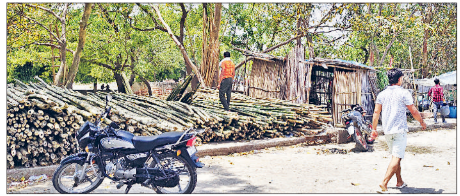
बहादुरगढ़। सांखोल के सामने पार्क में बनी बांस-बल्ली की दुकान।

जाम जैसे हालात बन जाते हैं। इसी तरह सांखोल के सामने बांस की टाटी से बनी अस्थायी दुकानों की कतारें लग गई हैं। सेक्टर-6 के दूसरे मोड़ से लेकर अंदरूनी और बाहरी सड़कों तक इस तरह के