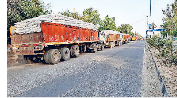
झज्जर। गुरुग्राम मार्ग पर वेयरहाउस के गोदाम के बाहर लगी ट्रकों की लंबी कतारें।

क्षेत्र के गांव तलाव स्थित हैफेड गोदाम और गुरुग्राम मार्ग पर लघुसचिवालय के नजदीक स्थित वेयर हाउस के गोदामों के बाहर इन दिनों गेहूं से भरे हुए ट्रकों की लंबी कतारें लगी हुई हैं। गाड़ियां खाली नहीं होने के कारण जहां ट्रक चालकों को परेशानी हो