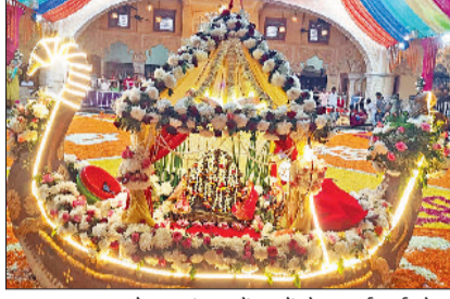
बहादुरगढ़। मनमोहक अंदाज में फूलों से सजाई गई नौका।

मनमोहक सजावट और भव्य आयोजन ने श्रद्धालुओं को भाव-विभोर कर दिया। नौका विहार के दौरान भक्तों ने दर्शन कर भगवान से सुख-समृद्धि की कामना की। कार्यक्रम के दौरान