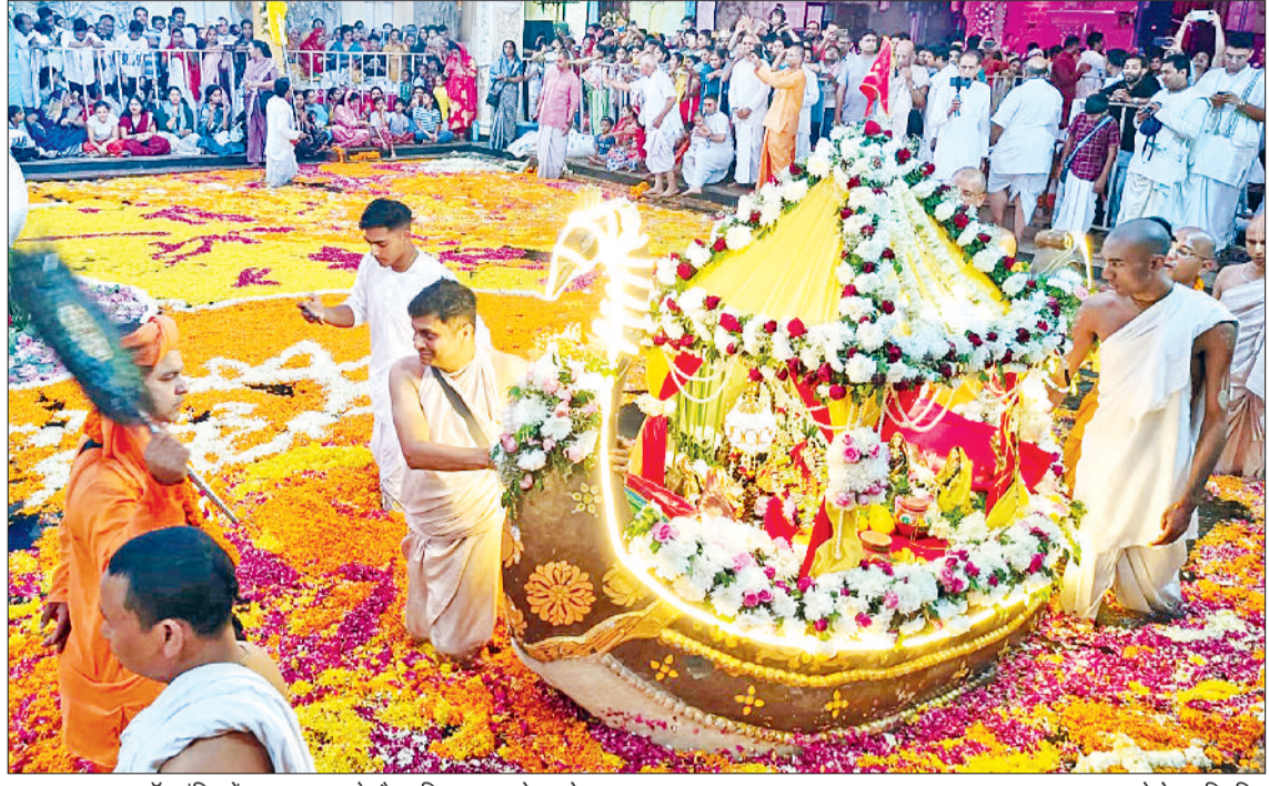
बहादुरगढ़। इस्कॉन मंदिर में राधा-कृष्ण को नौका विहार करवाते आयोजक।