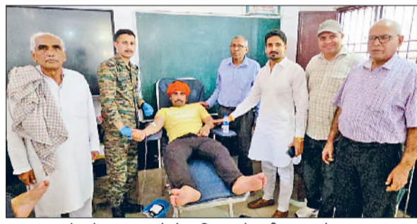
बहादुरगढ़। कैप में रक्तदाता को प्रोत्साहित करते ग्रामीण व आयोजक।