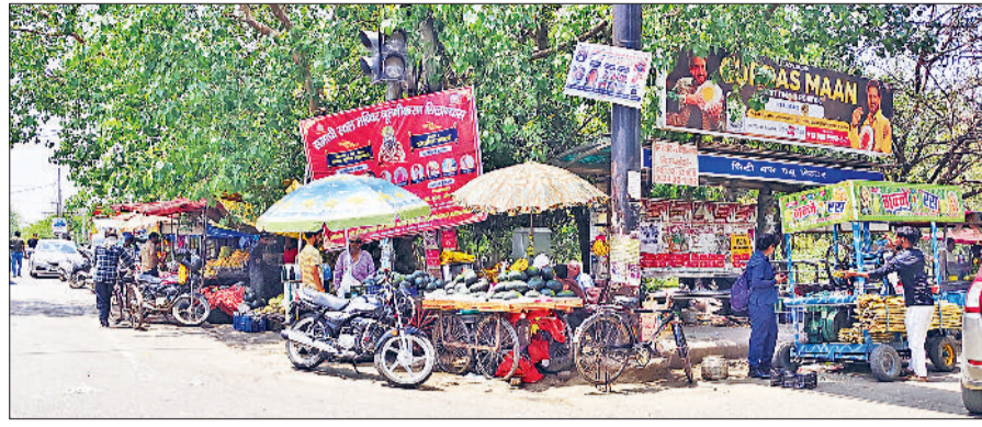
बहादुरगढ़। देवीलाल पार्क के मुहाने पर अवरोध बन रही रेहड़ियाँ।

आने वाले समय में यातायात व्यवस्था बुरी तरह प्रभावित हो सकती है। स्थानीय लोगों के अनुसार देवीलाल पार्क के किनारे लगने वाली फूट की रेहड़ियाँ अब लगभग स्थायी रूप ले चुकी हैं। दिनभर यहाँ भीड़ बनी रहती है और सड़क का एक बड़ा हिस्सा इन दुकानों के कारण घिरा रहता है। ऐसे में वाहन चालकों और पैदल राहगीरों को काफी दिक्कतों का सामना करना पड़ता है। ब्रिगेडियर होशियार सिंह मेट्रो स्टेशन के पास स्थिति और भी गंभीर देखने को मिलती है, जहाँ यात्रियों की भारी आवाजाही के बीच सड़क किनारे लगे ठेले और दुकानों के कारण निकलना तक मुश्किल हो जाता है। ई-रिक्शा व श्रौचलियों के कारण दिनभर यहाँ