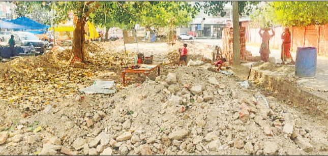
बहादुरगढ़। सेक्टर-9 में ग्रीन बेल्ट की बाउंड्री करते मिस्त्री-मजदूर।