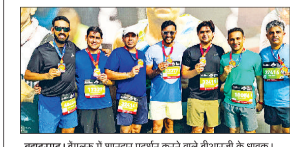
बहादुरगढ़। बंगलुरु में शानदार प्रदर्शन करने वाले बीआरजी के धावक।