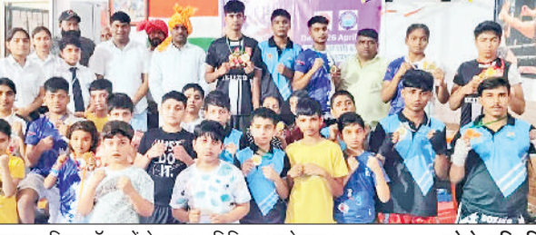
बहादुरगढ़। किक बॉक्सिंग के साथ अतिथि व आयोजक।