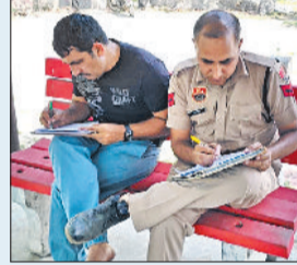
झंझर। नागरिक अस्पताल में पोस्टमार्टम के लिए कागजी कार्रवाई करते हुए पुलिसकर्मी।