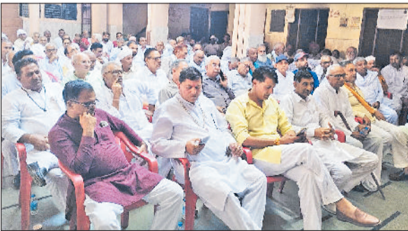
झंझर। बैठक में उपस्थित ब्राह्मण समाज के लोग।